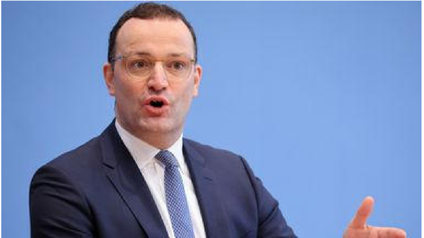
Bild: Der amtierende deutsche Gesundheitsminister Jens Spahn hat die Bevölkerung dringend zur Impfung aufgerufen.

Die Krankenhäuser warnen davor, dass die Kapazitäten der Intensivstationen nahezu erschöpft sind und einige Patienten in weiter entfernte Kliniken verlegt werden müssen.