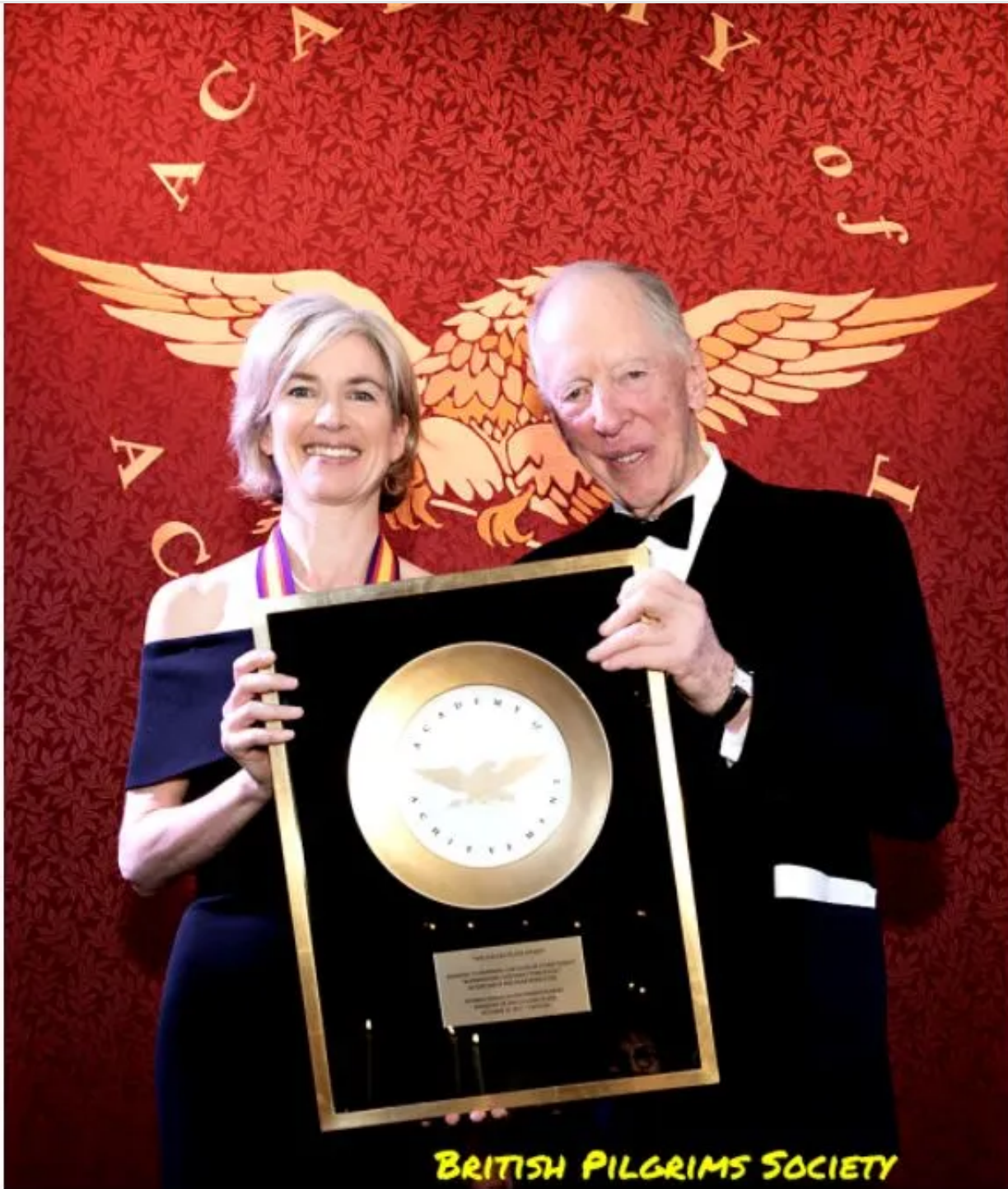
Awards Council member Lord Jacob Rothschild presents the Academy of Achievement's Golden Plate Award to Dr. Jennifer A. Doudna, co-developer of the CRISPR gene editing technology, in a ceremony at Claridge's in London.

ABB. 3 – GOLDEN PLATE AWARDS DER AMERICAN ACADEMY OF ACHIEVEMENT 2017 IN LONDON UNTER DER AUFSICHT DES DIREKTORS DER BRITISH PILGRIMS SOCIETY, BARON JACOB ROTHSCHILD , DER DR. JENNIFER A. DOUDNE VORSTELLT . DER OFFIZIELLE RICHTER NEIL GORSUCH ERHIELT EBENFALLS DIE AUSZEICHNUNG, EBENSO WIE GENERAL DAVID PETRAEUS UND DER VERRÄTER VON FOX NEWS, CHRIS WALLACE, DAS RAUBTIER BILL CLINTON, DER EHEMALIGE MINISTERPRÄSIDENT EHUD BARAK.