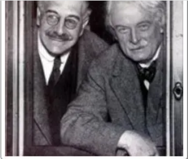
ABB. 4 – L/R: SIR ALFRED MOND , ZIONIST, PRÄSIDENT, BRUNNER MOND (SPÄTER ICI, ASTRAZENECA); PREMIERMINISTER DAVID LLOYD GEORGE , CA. 1914. MITBEGRÜNDER DER BRITISH PILGRIMS SOCIETY UND MITVERANSTALTER DER FIRST IMPERIAL PRESS CONFERENCE, 1909 .