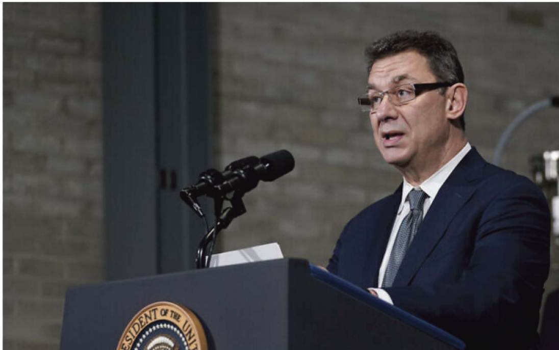
Pfizer CEO Albert Bourla speaks at a Pfizer manufacturing site, February 19, 2021, in Portage, Michigan.