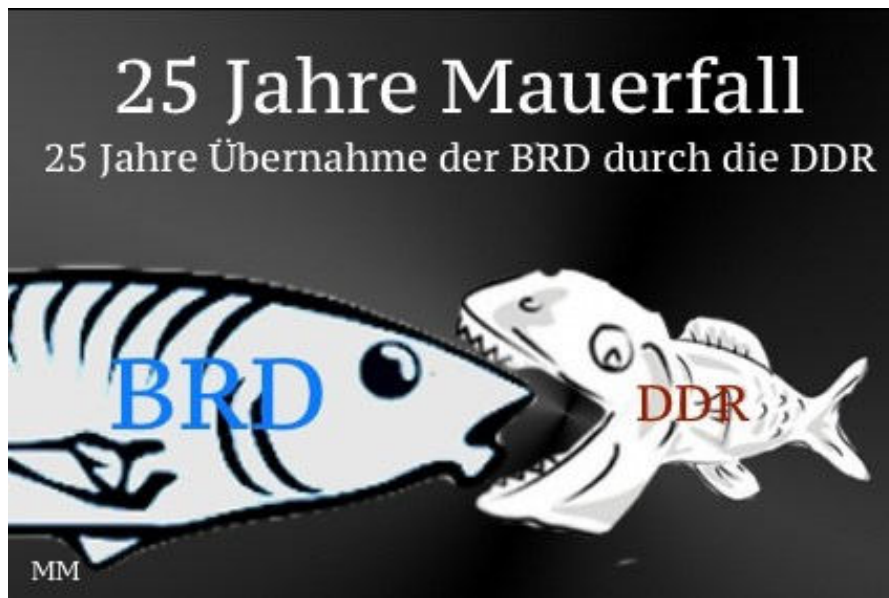
Ein Titelbild von mir zum 25. Jahrestag der „Wiedervereinigung“: Die kleine „DDR“ schluckte die große BRD

Diese „zuverlässigen“ Leute hat man. Es gibt nichts Zuverlässigeres als ein Stasi-Mitarbeiter. Nur mit der rechtsstaatlichen Gesinnung hapert's. Macht nix. Denn die Wiedervereinigung war eh nie, wie man uns lehrt, die Übernahme der kleinen DDR durch die große BRD. Sondern es war, wie ich schon vor Jahren schrieb, der größte Coup der Stasi und einer der größten Coups der Weltgeschichte: Ein kleines kommunistisches Land hat seinen großen und mächtigen kapitalistischen Bruder förmlich aufgefressen. Heute regiert die SED wie eh und je. Die DDR2.0 ( Tarnbegriff BRD ) wird wieder von einer DDR-treuen Staatsratsvorsitzenden regiert, die SED – damals ein Junktim zwischen der OstS-PD und Ost-KPD – wurde quasi nahtlos durch eine SED2.0 ersetzt ( Junktim CDU-SPD ) – und auch die Blockparteinen haben wir wieder.