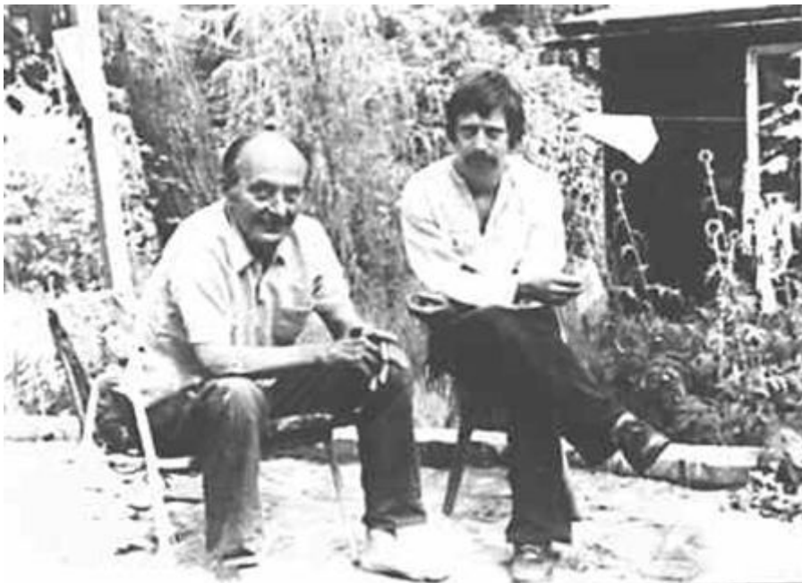
Robert Havemann mit dem DDR-Liedermacher Wolf Biermann

Die grösste Aktion in der Geschichte der Stasi der DDR war die dauernde Observation des kritischen deutschen Regimekritikers und Kommunisten Robert Havemann.