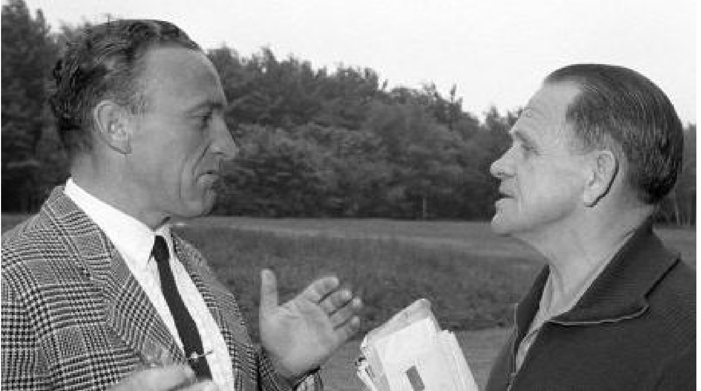
Argentinien 1978: Besuch vom Stuka-Oberst